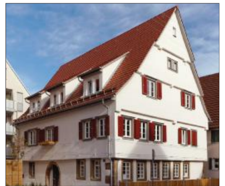
Die Alte Wagnerei in Fellbach wurde saniert.

Architekturbüro Weinmann Remsstraße 24 71384 Weinstadt Telefon 07151 609894 weinmann.aiw-weinstadt.de