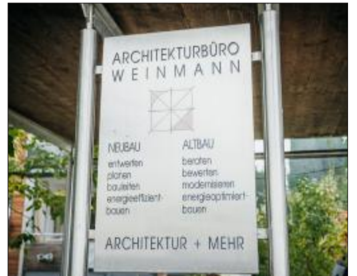
Das Architekturbüro befindet sich in Endersbach.