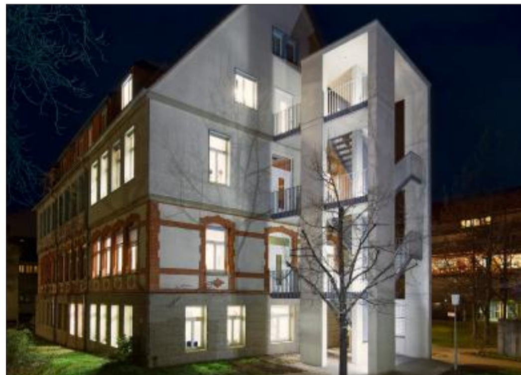
Anbau einer Fluchttreppe an der Schlossschule Stetten.