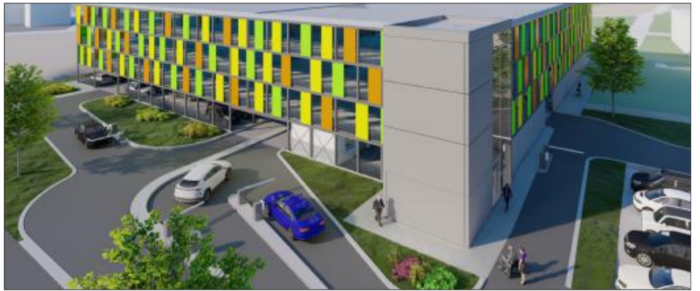
Das Parkhaus am RMK in Winnenden wurde 2022 nach Plänen des Weinstädter Büros gebaut.

Öffentliche Bauten auch dabei Öffentliche Bauten wie das Parkhaus am RMK in Winnenden (2022) oder die Schlossschule Stetten (Anbau einer Fluchttreppe, 2022) dokumentieren zudem die Bandbreite des Büros - von privaten bis kommunalen Projekten, von Neubau bis Bestand.