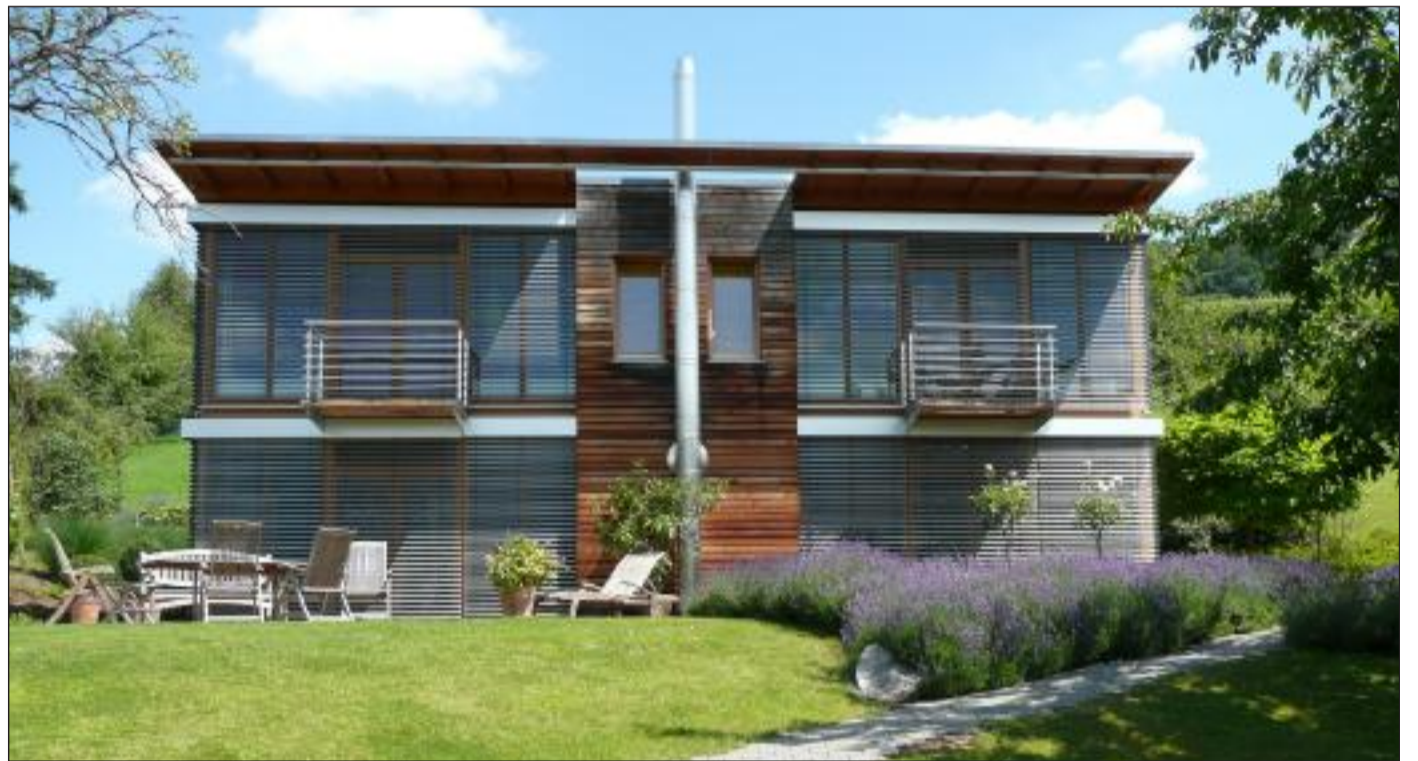
Das Einfamilienhaus in Weinstadt-Gundelsbach dient bis heute als Referenz-Objekt.